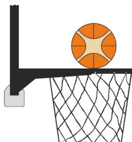
Figure 2 : Ballon en contact avec l'anneau

Il y a intervention illégale par un joueur défenseur ou attaquant si, lors d'un tir au panier, un joueur touche le panier ou le panneau alors que le ballon est en contact avec l'anneau et qu'il a encore la possibilité de rentrer dans le panier.